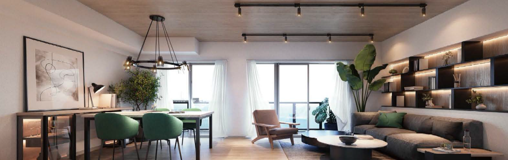
※掲載のイメージは一部オプション等を含んだAタイプの図面を基に描き起こしたもので実際とは異なります。※家具・調度品等は配置例イメージであり販売価格には含まれません。※掲載の室内パースは有償オプション、設計変更(いずれも申込期限有)が含まれています。