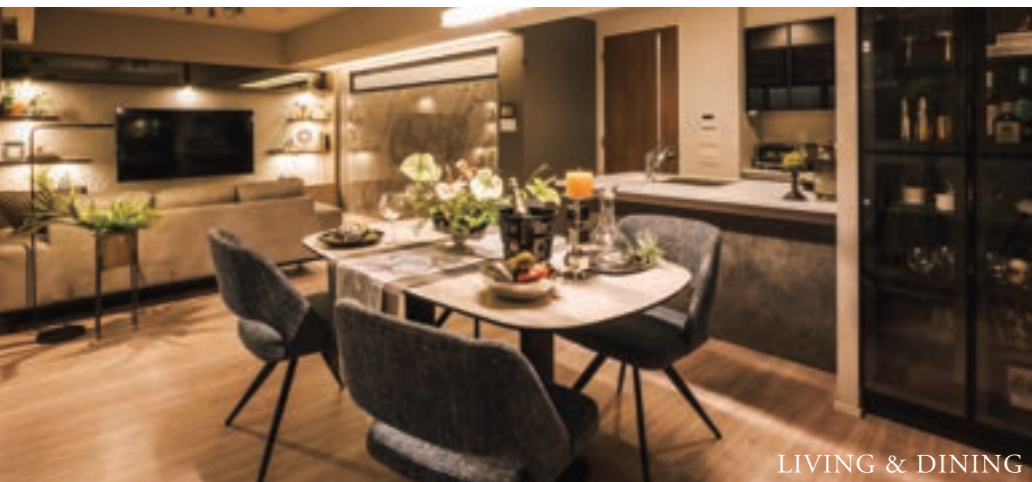
LIVING & DINING