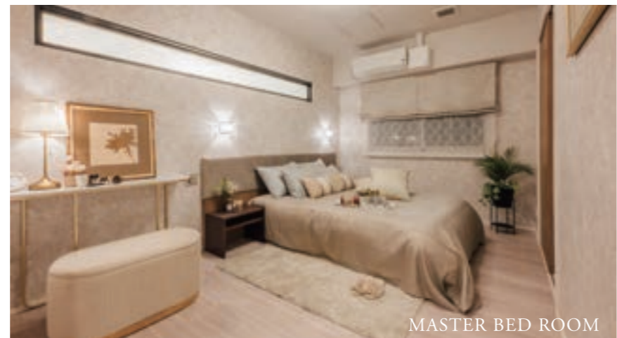
MASTER BED ROOM