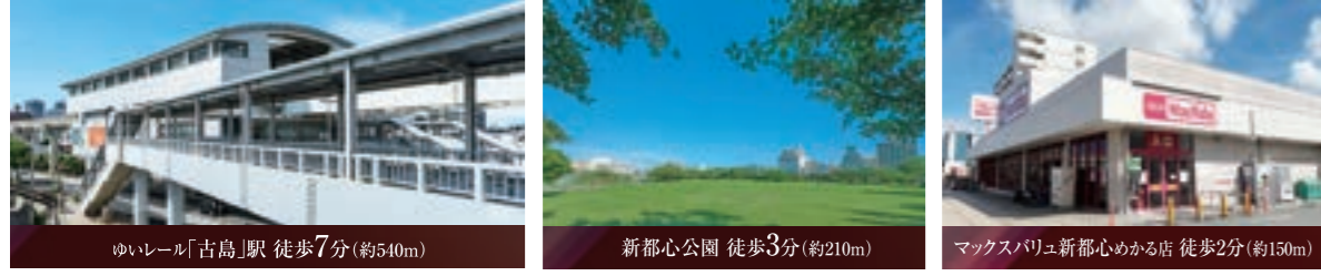
※表示距離は現地からの地図上の概算です。徒歩分は80m=1分として算出し、端数は切り上げております。※地図は簡略化しています。※掲載の環境写真は2023年4月、2024年1月・2月に撮影したものです。

物件概要 ●物件名/ワイズエステムコート新都心銘苅 ●所在地/沖縄県那覇市銘苅1丁目10-1 ●交通/ゆいレール「古島」駅徒歩7分(約540m) ●地域/第二種低層住居専用地域 ●建築確認番号/第沖確R05160211号(令和5年12月15日) ●構造/鉄筋コンクリート造、地上12階建 ●総戸数/31戸 ●敷地面積/1,111.28㎡ ●建築確認敷地面積/1,111.28㎡ ●建築面積/308.09㎡ ●建築延べ床面積/2,671.00㎡(容積不算入面積450.25㎡) ●建ぺい率/60.00%(法定)、27.73%(対象) ●容積率/200.00%(法定)、199.84%(対象) ●専有床面積/62.56㎡~90.88㎡ ●バルコニー面積/13.23㎡~37.73㎡ ●アルコーブ面積/3.18㎡~6.04㎡ ●専用ポーチ面積/5.39㎡ ●インナーテラス面積/12.10㎡ ●ルーフトバルコニー面積/72.28㎡ ●間取り/3LDK ●権利形態/敷地は専有床面積割合による共有、建物専有部分は区分所有権、建物共用部分は専有床面積割合による共有 ●管理形態/区分所有者全員により管理組合を設立し、管理会社に委託 ●管理員の勤務形態/通勤管理方式(日勤) ●駐車場/51区画(61台) 月額使用料:3,500円~17,000円 ●駐輪場/7区画 月額使用料:200円 ●着工/2023年12月25日 ●竣工予定/2025年7月下旬 ●入居開始予定/2025年8月下旬 ●施工/南洋土建株式会社 ●設計・監理/株式会社泉設計 ●管理会社/株式会社エステム管理サービス ●手付金等保証機関/全国不動産信用保証株式会社 ●設計図書閲覧所/エールクリエイト株式会社(竣工後は管理室) ●事業主・売主/株式会社エステム 〒542-0081 大阪府大阪市中央区南船場2丁目9番14号 TEL:06(7660)1155(代表) 宅地建物取引業免許証番号/国土交通大臣(4)第7029号 一級建築士事務所 大阪府知事登録(ホ)第17185号・近畿中高層不動産協会会員、エールクリエイト株式会社 〒900-0012 沖縄県那覇市泊1丁目11番地9 TEL:098(860)2929(代表) 宅地建物取引業免許証番号/国土交通大臣(2)第8803号 (一社)九州不動産公正取引協議会(公社)全国宅地建物取引業協会(公社)全国宅地建物取引業保証協会(公社)沖縄県宅地建物取引業協会 ●販売代理/株式会社エステム 宅宅販売 〒542-0081 大阪府大阪市中央区南船場2丁目9番14号 TEL:06-7660-1177(代表) 宅地建物取引業免許証番号/国土交通大臣(4)第7151号 (一社)近畿住宅産業協会(公社)近畿地区不動産公正取引協議会 ●第二期販売概要 ●販売戸数/31戸 ●専有床面積/70.22㎡、75.44㎡ ●バルコニー面積/13.23㎡、14.63㎡ ●間取り/3LDK ●販売価格(税込)/6,270万円(1戸)~6,980万円(1戸) ●管理費(月額)/11,020円、11,840円 ●修繕積立金(月額)/5,610円、6,030円 ●修繕積立基金(一括)/448,800円、482,400円 ●広告有効期限/2024年12月1日